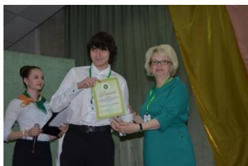
Награждение победителя 3 место в личном зачете

Во второй день олимпиады 21 апреля 2015 г. , пока конкурсанты проходили тестирование, в Алтайской академии гостеприимства прошёл семинар «Современные подходы и технологии эффективной подготовки кадров для сферы гостиничной индустрии».