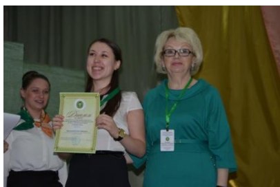
Награждение победителя 1 место в личном зачете