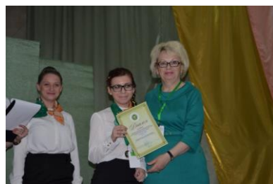
Награждение победителя 2 место в личном зачете