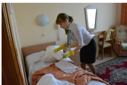
Практическое задание «Уборка номера»