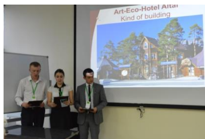
Презентация гостиницы на английском языке