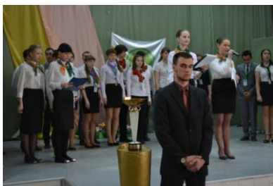
Церемония торжественного открытия олимпиады

В ходе масштабного мероприятия студенты Алтайского края соревновались за звание «лучших» в своем деле и они это доказали.