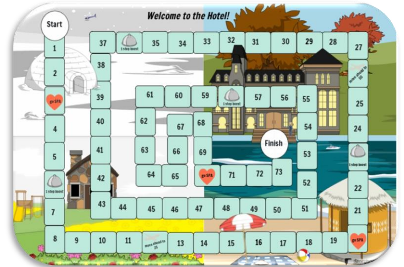
Настольная игра «Добро пожаловать в отель» (на английском языке)