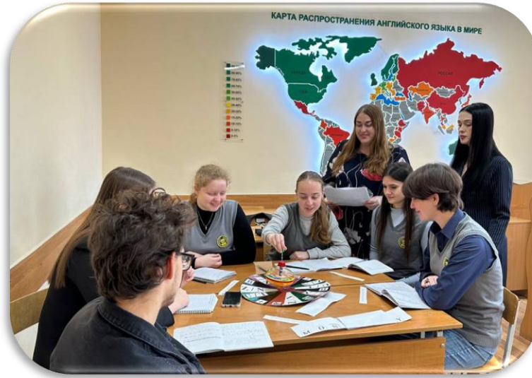
Настольная игра «Поле Чудес» (на немецком и английском языках)